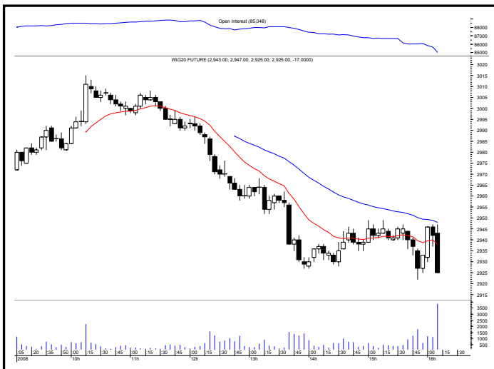
Rys. nr 2 FW20 - wykres intra 5 minutowy i liczba otwartych pozycji