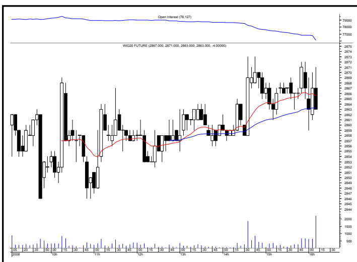
Rys. nr 2 FW20 - wykres intra 5 minutowy ostatniej sesji i liczba otwartych pozycji