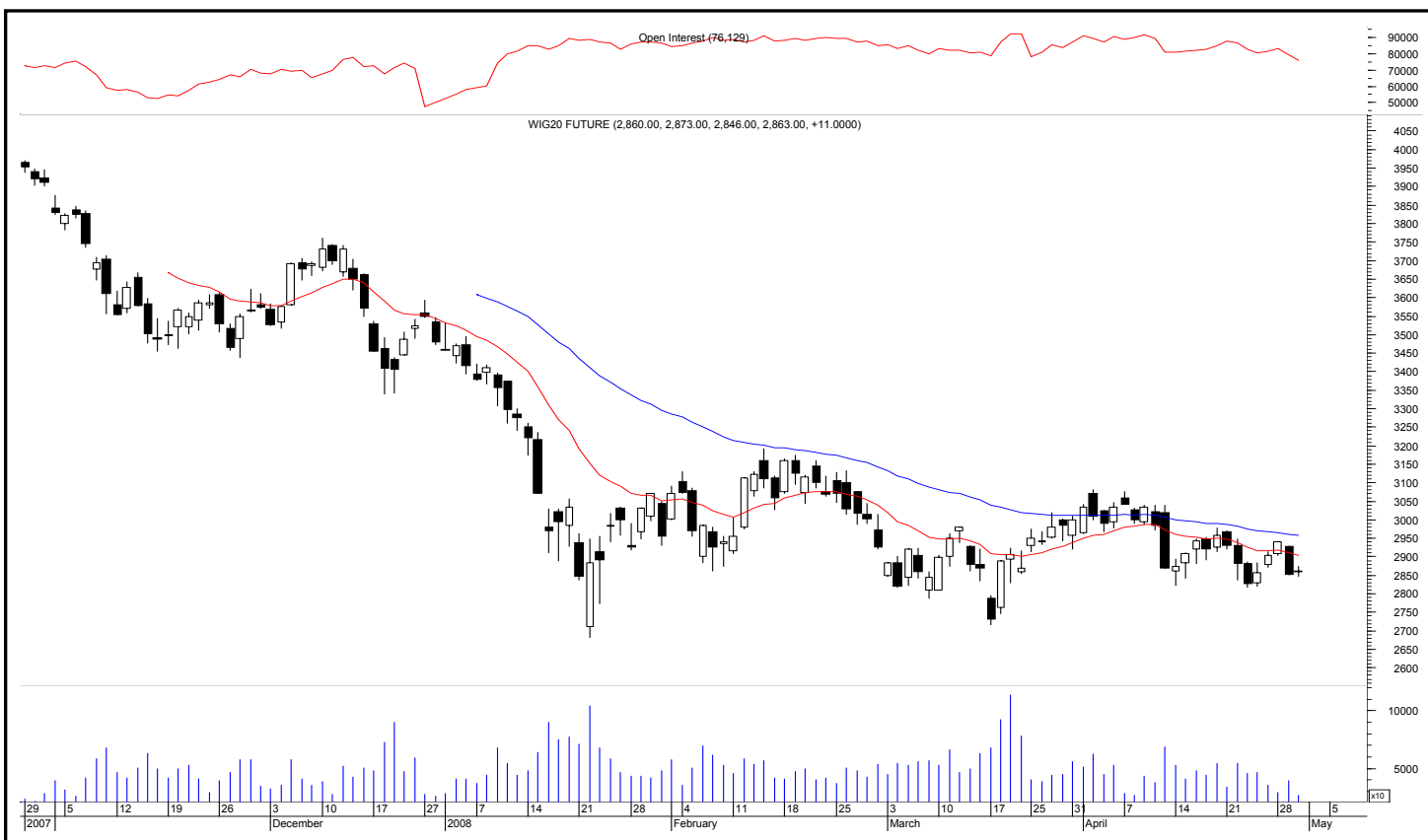
Rys. nr 1 FW20 - wykres dzienny świecowy i średnie wykładnicze 15 i 45 oraz liczba otwartych pozycji

Kontrakty terminowe na WIG 20 - komentarz