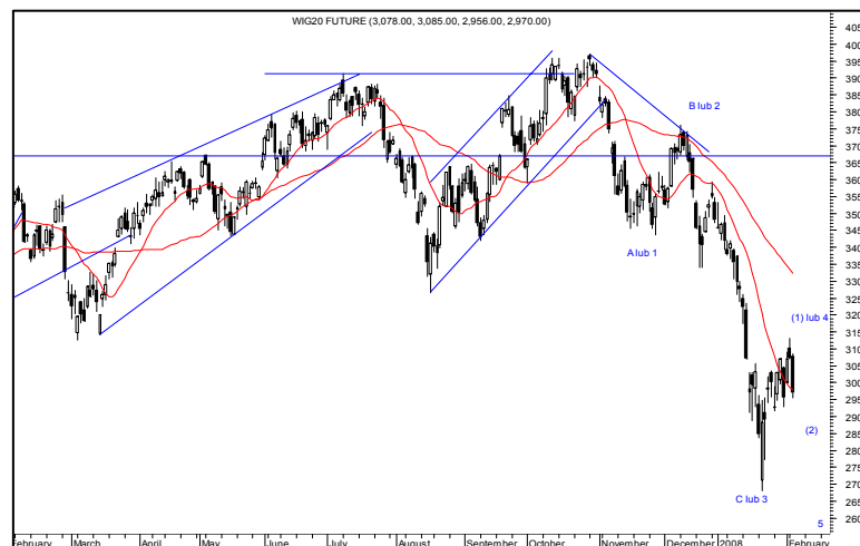
Rys. nr 3 FW20 - wykres dzienny