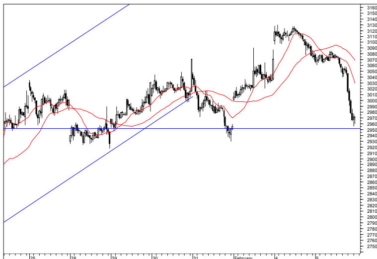
Rys. nr 1 FW20 - wykres 15 min

Przy schodzeniu kontraktu poniżej poziomu 3035 pkt. została otwarta pozycja krótka. Zlecenie stop ustawiliśmy na poziomie 3040 pkt. i dzisiaj pozostawimy je w tym samym miejscu. W przypadku aktywowania zlecenia stop do pozycji krótkiej powrócimy jeżeli kontrakt zejdzie poniżej poziomu 3035 pkt.