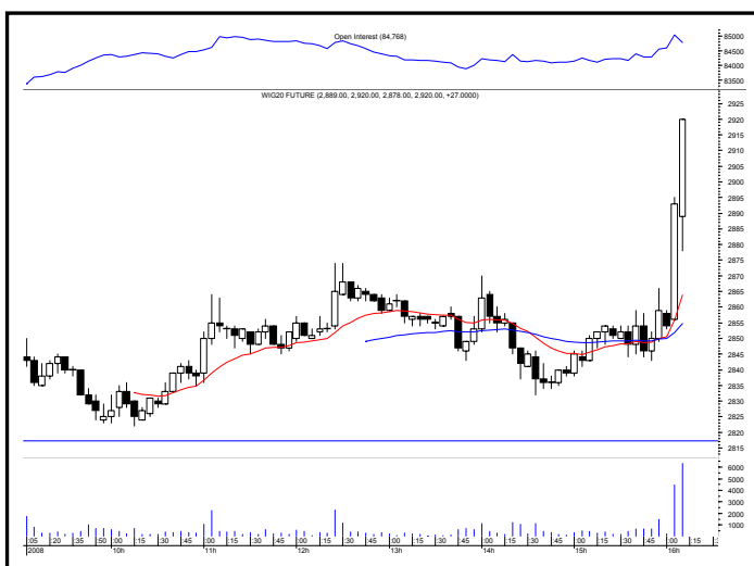
Rys. nr 2 FW20 - wykres intra 5 minutowy wczorajszej sesji i liczba otwartych pozycji