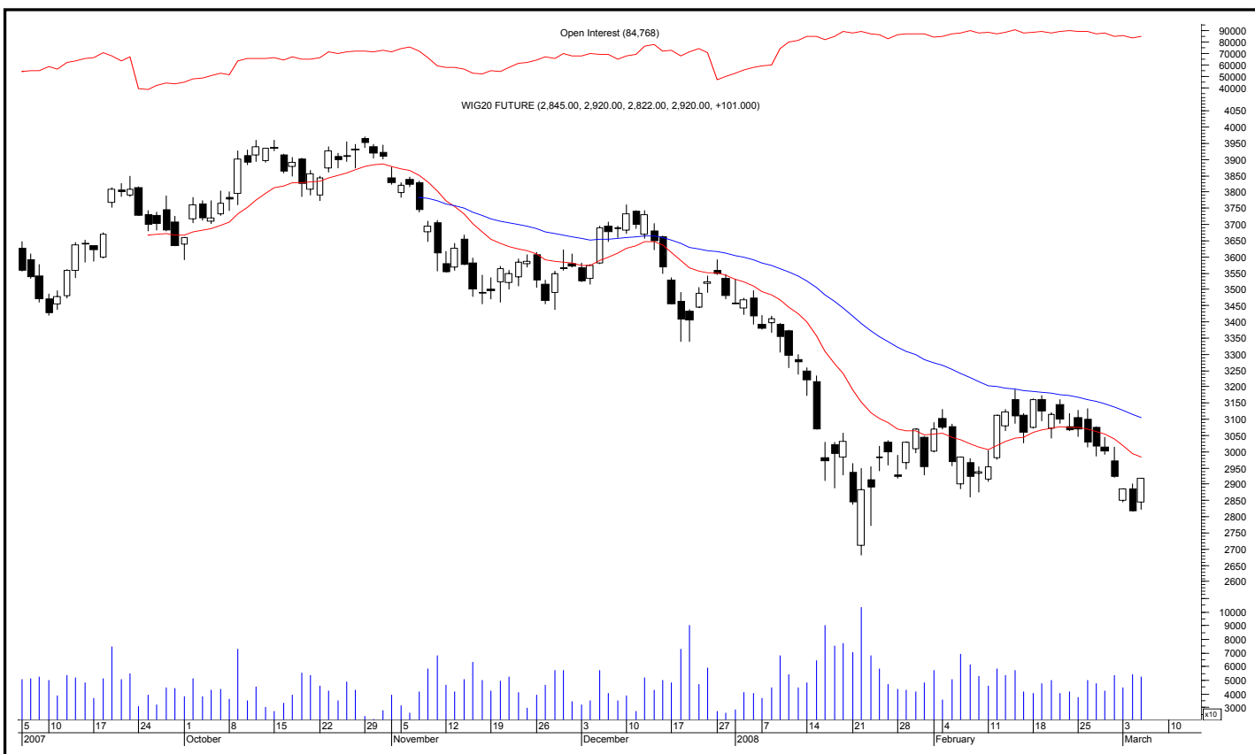
Rys. nr 1 FW20 - wykres dzienny świecowy i średnie wykładnicze 15 i 45 oraz liczba otwartych pozycji

Kontrakty terminowe na WIG 20 - komentarz