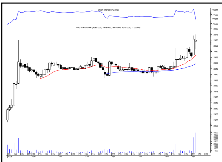
Rys. nr 2 FW20 - wykres intra 5 minutowy ostatniej sesji i liczba otwartych pozycji