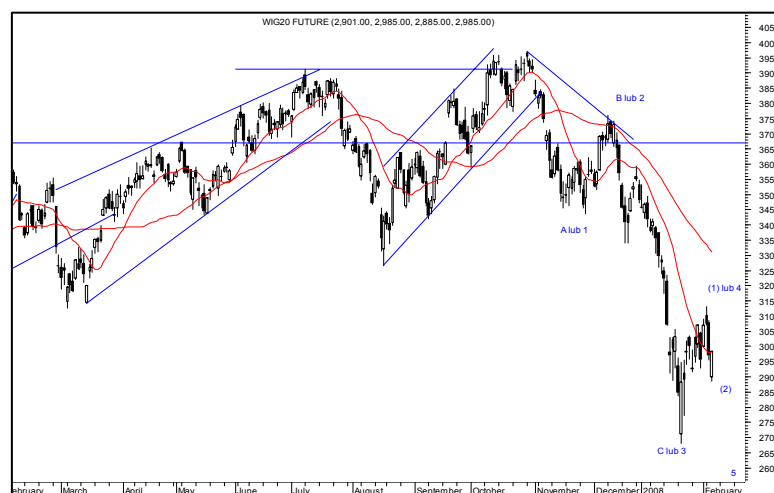
Rys. nr 3 FW20 - wykres dzienny