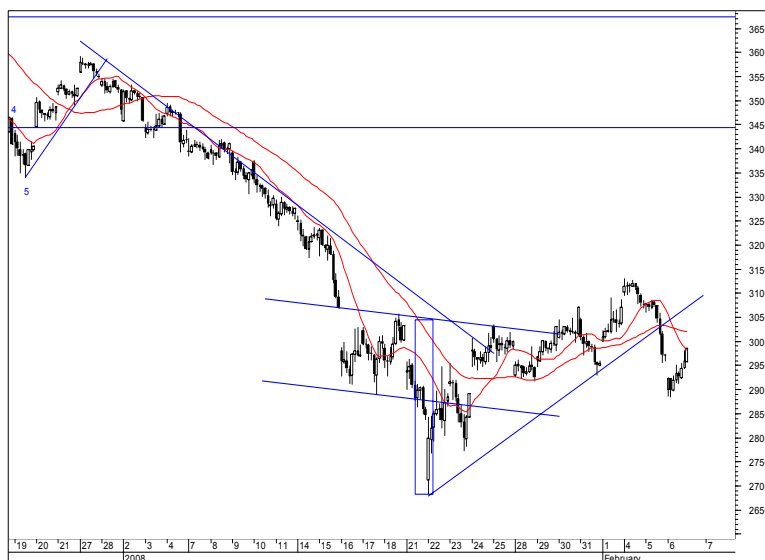
Rys. nr 2 FW20 - wykres 60 min