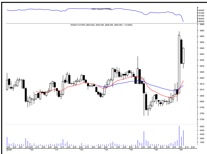
Rys. nr 2 FW20 - wykres intra 5 minutowy i liczba otwartych pozycji