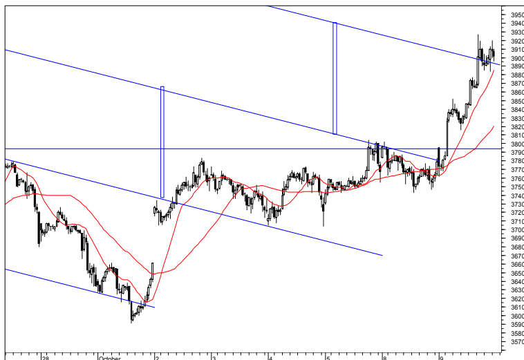
Rys. nr 1 FW20 - wykres 15 min