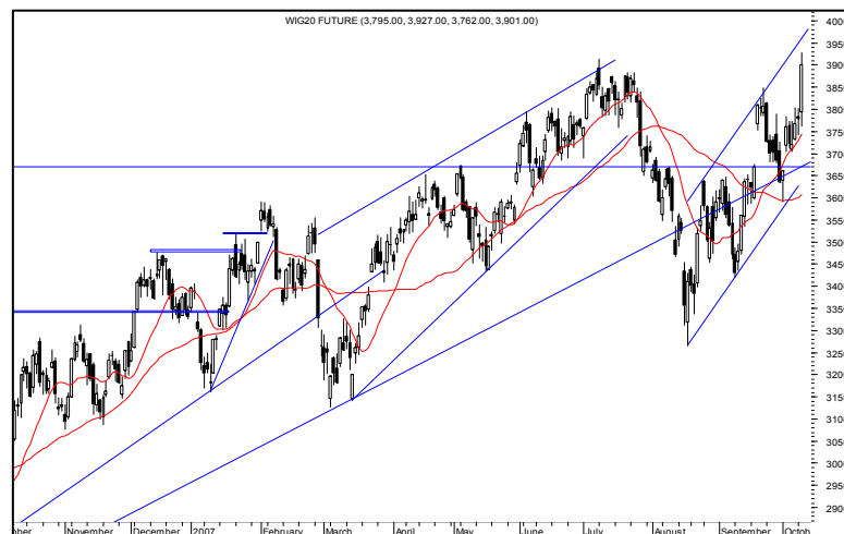
Rys. nr 3 FW20 - wykres dzienny