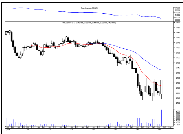
Rys. nr 2 FW20 - wykres intra 5 minutowy ostatniej sesji i liczba otwartych pozycji