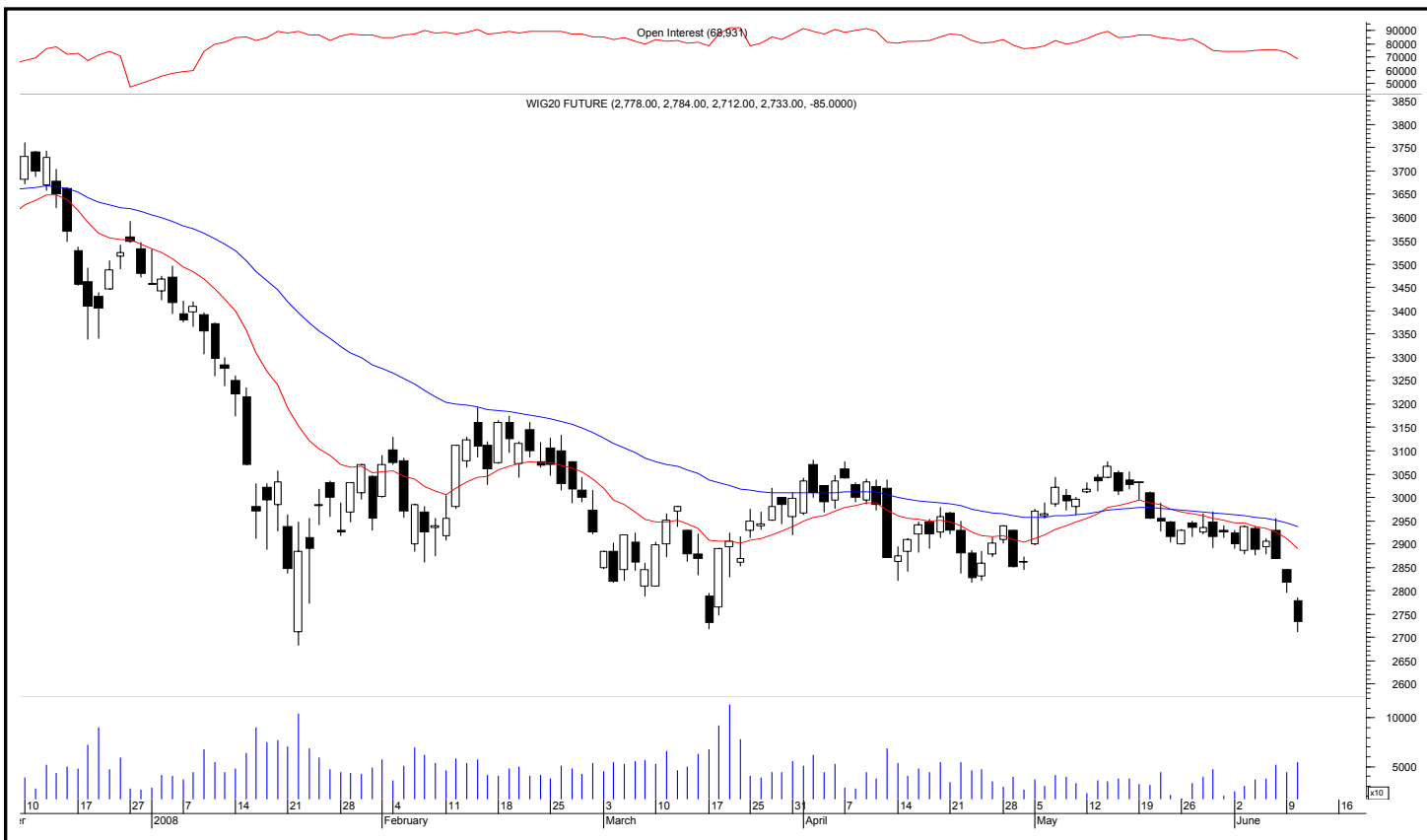
Rys. nr 1 FW20 - wykres dzienny świecowy z ostatniego półrocza i średnie wykładnicze 15 i 45 oraz liczba otwartych pozycji

Kontrakty terminowe na WIG 20 - komentarz