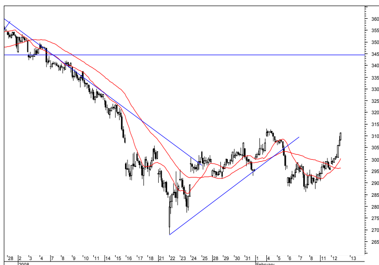
Rys. nr 2 FW20 - wykres 60 min