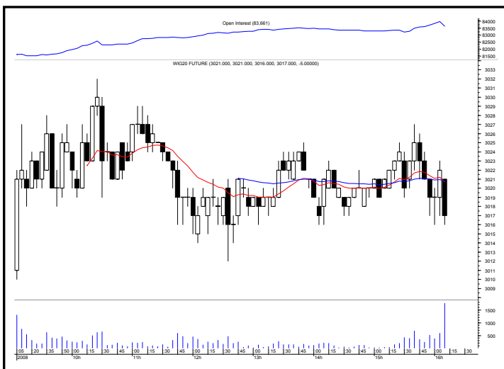
Rys. nr 2 FW20 - wykres intra 5 minutowy ostatniej sesji i liczba otwartych pozycji