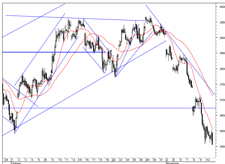
Rys. nr 2 FW20 - wykres 60 min