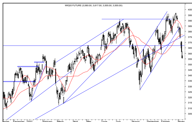
Rys. nr 3 FW20 - wykres dzienny