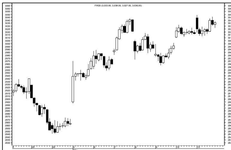
Rys. nr 2 FW20 - wykres 60 min