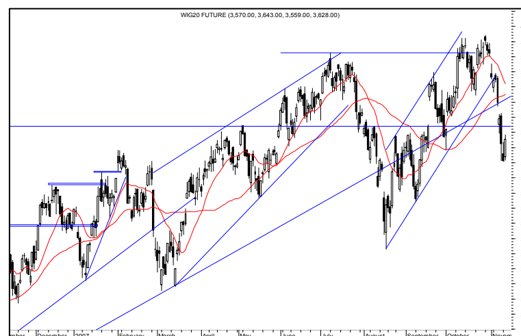
Rys. nr 3 FW20 - wykres dzienny