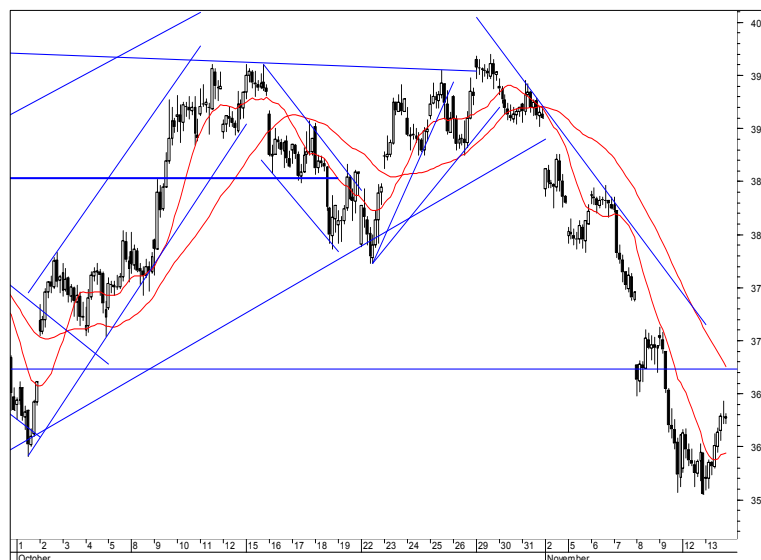
Rys. nr 2 FW20 - wykres 60 min