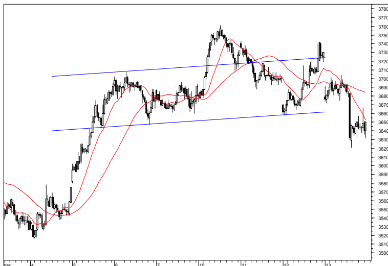
Rys. nr 1 FW20 - wykres 15 min

Pozycja krótka została otwarta przy schodzeniu kontraktu poniżej poziomu 3647 pkt. Zlecenie stop dla pozycji krótkiej ustawiliśmy na poziomie 3652 pkt. i dzisiaj pozostawimy je na tym samym poziomie. W przypadku aktywowania zlecenia stop do pozycji krótkiej powrócimy gdy kontrakt zejdzie poniżej poziomu 3627 pkt. Jeżeli kontrakt wyjdzie w górę powyżej poziomu 3704 pkt. otworzymy pozycję długą. Dla każdej nowo otwartej pozycji zlecenie stop ustawimy w odległości pięciu punktów od poziomu transakcji.