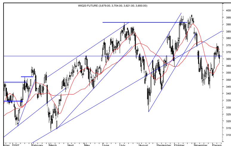
Rys. nr 3 FW20 - wykres dzienny