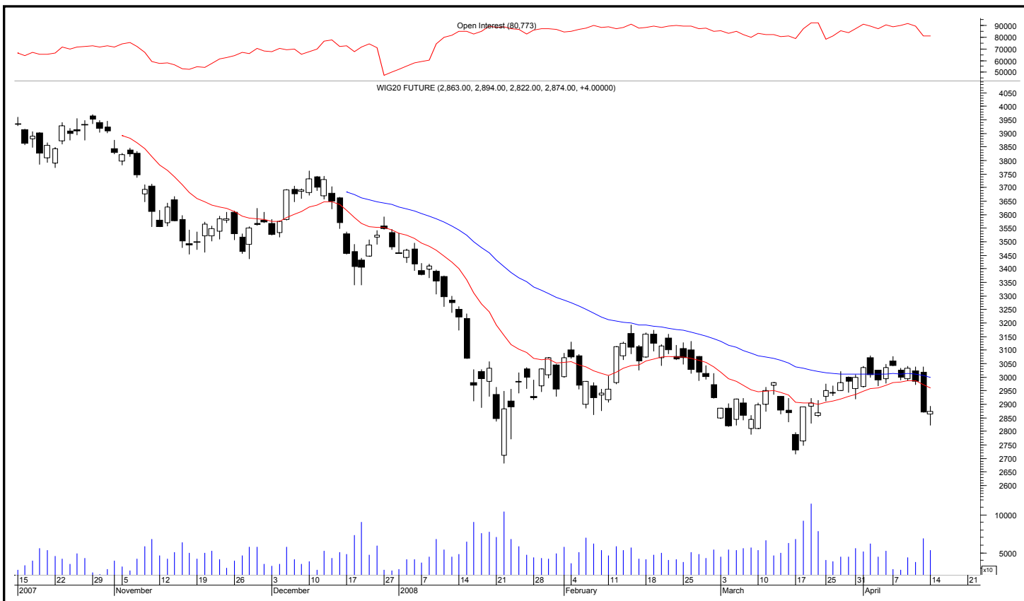
Rys. nr 1 FW20 - wykres dzienny świecowy i średnie wykładnicze 15 i 45 oraz liczba otwartych pozycji

Kontrakty terminowe na WIG 20 - komentarz