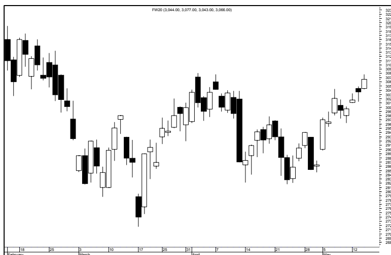
Rys. nr 3 FW20 - wykres dzienny