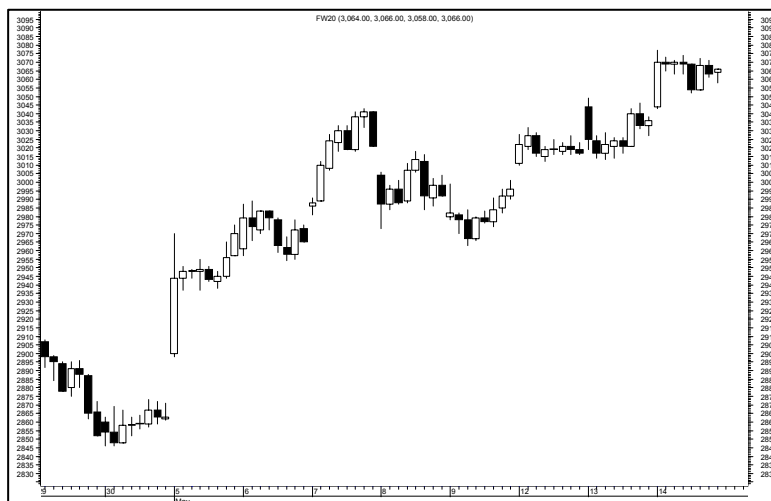
Rys. nr 2 FW20 - wykres 60 min