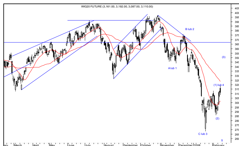
Rys. nr 3 FW20 - wykres dzienny