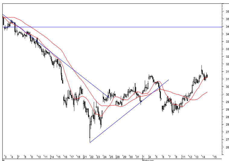
Rys. nr 2 FW20 - wykres 60 min