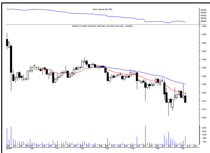
Rys. nr 2 FW20 - wykres intra 5 minutowy ostatniej sesji i liczba otwartych pozycji