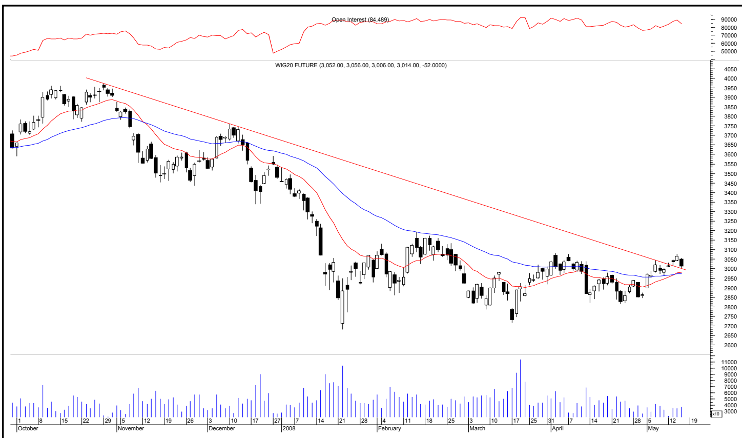
Rys. nr 1 FW20 - wykres dzienny świecowy i średnie wykładnicze 15 i 45 oraz liczba otwartych pozycji

Kontrakty terminowe na WIG 20 - komentarz