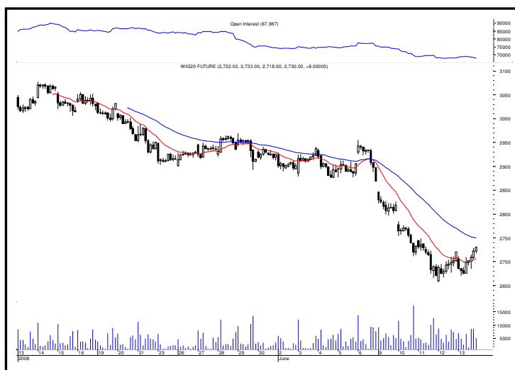
Rys. nr 2 FW20 - wykres 60 min z ostatniego miesiąca i liczba otwartych pozycji