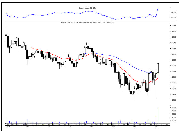
Rys. nr 2 FW20 - wykres intra 5 minutowy ostatniej sesji i liczba otwartych pozycji