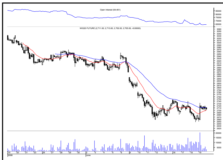
Rys. nr 2 FW20 - wykres 60 min z ostatniego miesiąca i liczba otwartych pozycji