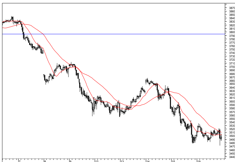
Rys. nr 1 FW20 - wykres 15 min

Dzisiaj pozycję krótką otworzymy jeżeli kontrakt wyjdzie powyżej poziomu 3550 pkt. i zejdzimy w dół poniżej poziomu 3540 pkt. Pozycję krótką otworzymy również w przypadku zejścia kontraktu poniżej poziomu 3497 pkt. Dla każdej nowo otwartej pozycji zlecenie stop ustawimy w odległości pięciu punktów od poziomu transakcji.