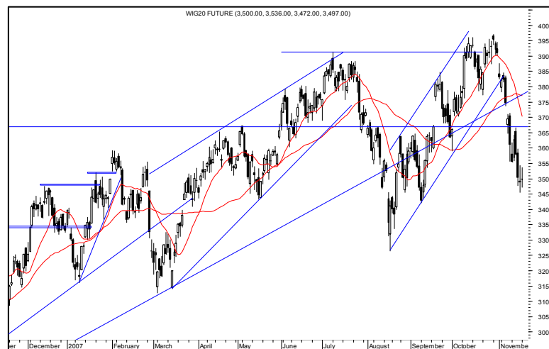
Rys. nr 3 FW20 - wykres dzienny