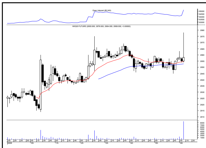
Rys. nr 2 FW20 - wykres 60 min i liczba otwartych pozycji

W dniu dzisiejszym pozostaniemy bez pozycji