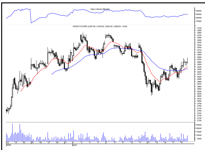
Rys. nr 2 FW20 - wykres intra 5 minutowy ostatniej sesji i liczba otwartych pozycji