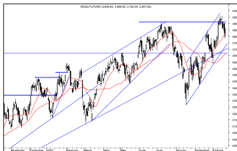
Rys. nr 3 FW20 - wykres dzienny