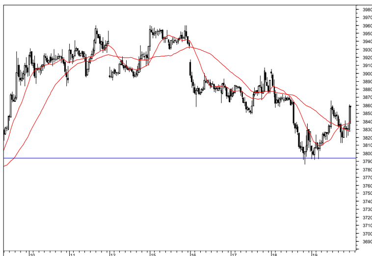
Rys. nr 1 FW20 - wykres 15 min

Dzisiaj w przypadku wyjścia kontraktu powyżej poziomu 3860 pkt. otworzymy pozycję długą. Jeżeli kontrakt zejdzie poniżej poziomu 3710 pkt. otworzymy pozycję krótką. Dla każdej nowo otwartej pozycji zlecenie stop ustawimy w odległości pięciu punktów od poziomu transakcji.