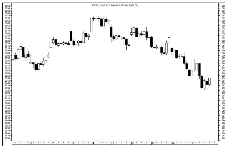
Rys. nr 2 FW20 - wykres 60 min