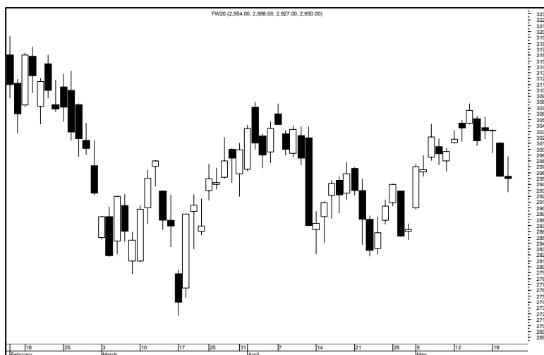
Rys. nr 3 FW20 - wykres dzienny