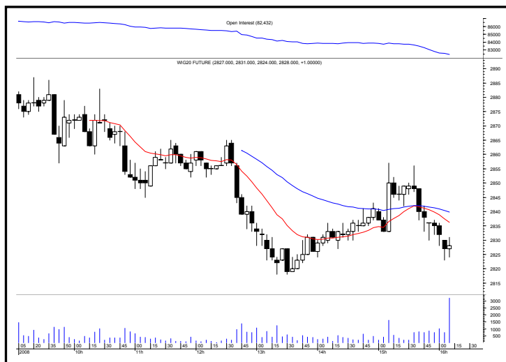
Rys. nr 2 FW20 - wykres 60 min i liczba otwartych pozycji

Pozycję krótką otwartą po 2913 pkt. we wtorek zastopujemy dziś na poziomie 2884 pkt.