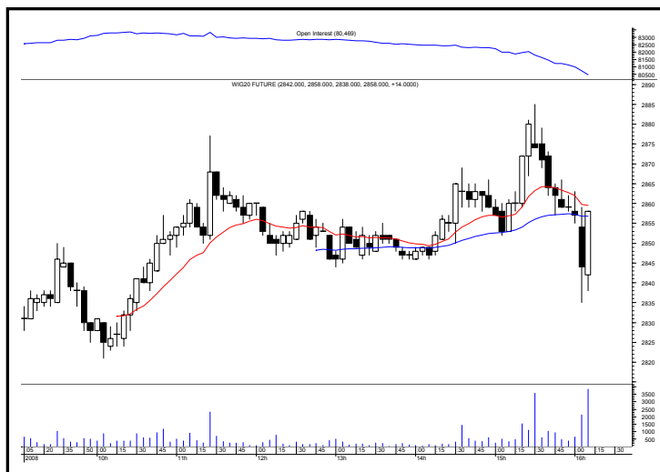
Rys. nr 2 FW20 - wykres 60 min i liczba otwartych pozycji

Pozycję krótką otwartą po 2913 pkt. zamknęliśmy wczoraj po 2884 pkt. Dziś pozostaniemy bez pozycji.