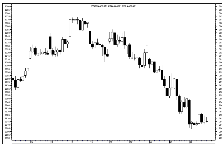
Rys. nr 2 FW20 - wykres 60 min