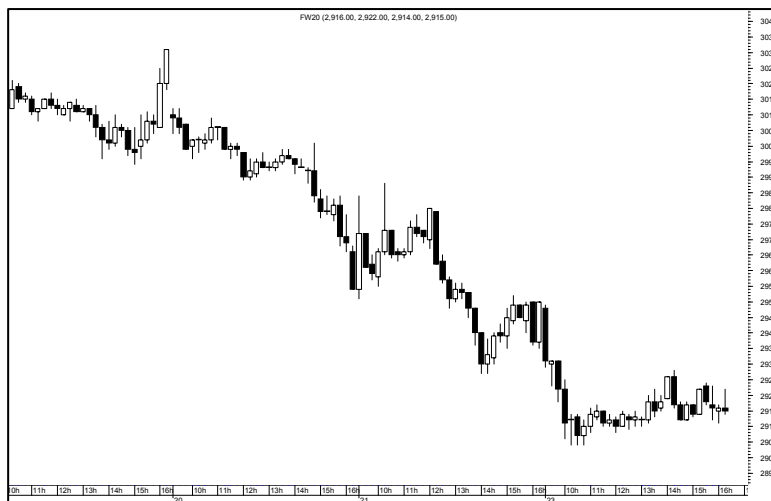
Rys. nr 1 FW20 - wykres 15 min

Najbezpieczniejsze podejście do ustawianie sygnału kupna lub stop loss dla krótkiej powyżej ostatniego maksimum czyli po 2950. Jeśli kontrakty będą w stanie wyjść powyżej tego maksimum to będzie znaczyło, że anulowały sygnał sprzedaży na średniej z 45 sesji. W innym przypadku nie ma powodów do otwierania pozycji długiej. Na zamknięcie tygodnia indeks pokonał wsparcie na 2950 otwierając sobie drogę do kolejnego wsparcia na 2870 – zresztą ostatniego, dalej nie ma już wsparć.