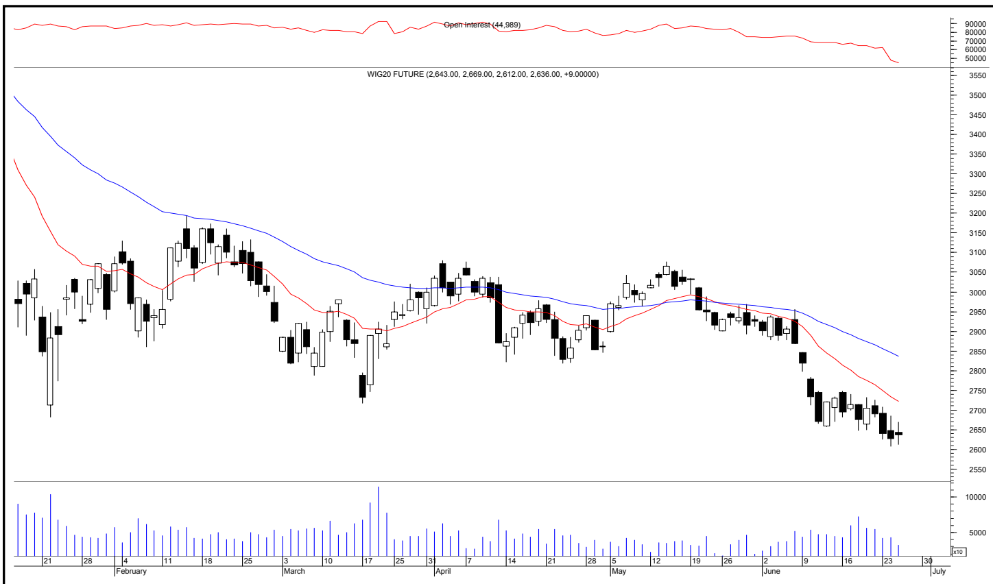
Rys. nr 1 FW20 - wykres dzienny świecowy z ostatniego półrocza i średnie wykładnicze 15 i 45 oraz liczba otwartych pozycji

Kontrakty terminowe na WIG 20 - komentarz