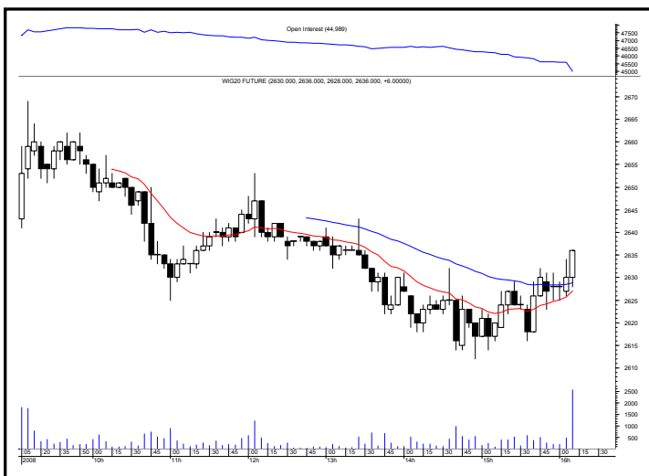
Rys. nr 2 FW20 - wykres intra 5 minutowy ostatniej sesji i liczba otwartych pozycji