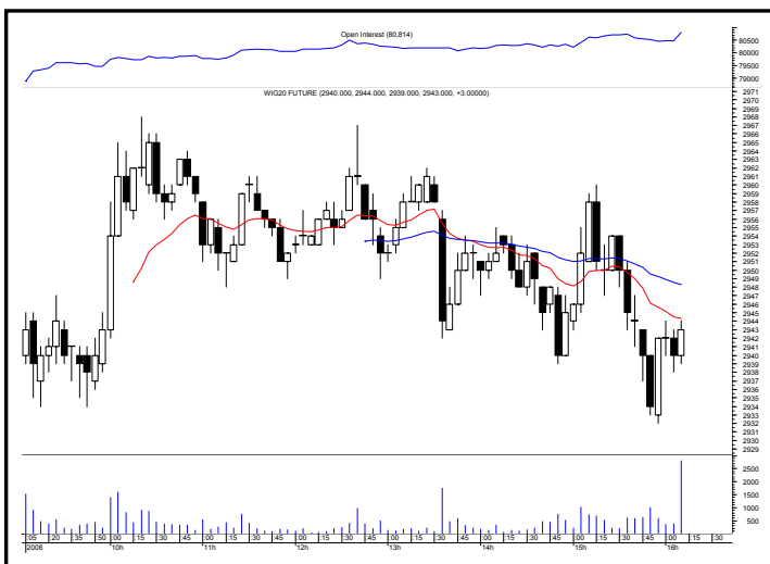
Rys. nr 2 FW20 - wykres intra 5 minutowy wczorajszej sesji i liczba otwartych pozycji