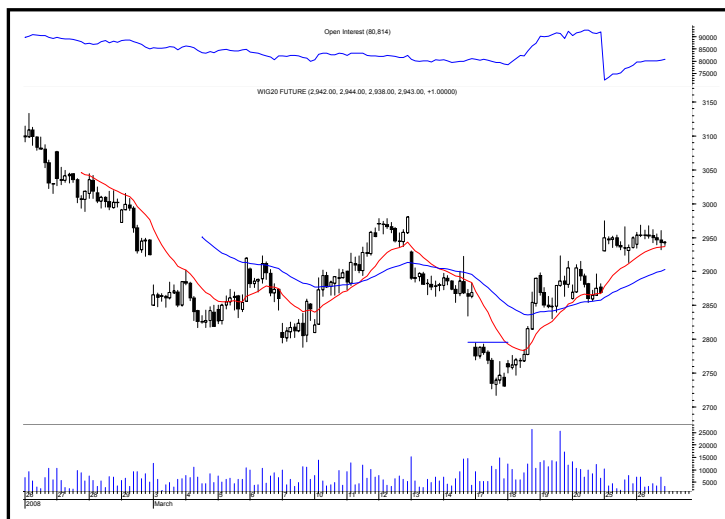
Rys. nr 2 FW20 - wykres 60 min i liczba otwartych pozycji

Jeśli otwarcie nastąpi mniej niż 16 pkt. od średniego zamknięcia otworzymy pozycję długą po 2976 pkt. lub krótką po 2912 pkt. Dla otwartej pozycji stop w odległości 6 pkt.