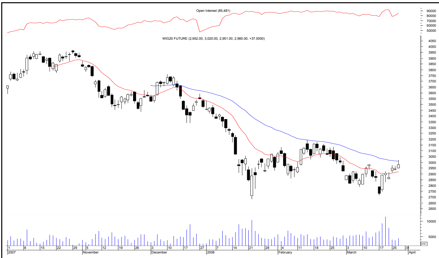
Rys. nr 1 FW20 - wykres dzienny świecowy i średnie wykładnicze 15 i 45 oraz liczba otwartych pozycji

Kontrakty terminowe na WIG 20 - komentarz