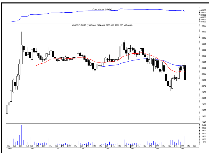
Rys. nr 2 FW20 - wykres intra 5 minutowy ostatniej sesji i liczba otwartych pozycji