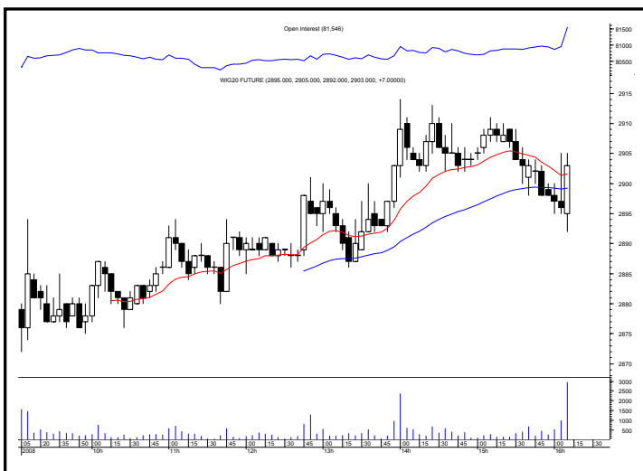
Rys. nr 2 FW20 - wykres intra 5 minutowy ostatniej sesji i liczba otwartych pozycji