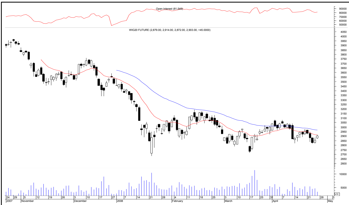
Rys. nr 1 FW20 - wykres dzienny świecowy i średnie wykładnicze 15 i 45 oraz liczba otwartych pozycji

Kontrakty terminowe na WIG 20 - komentarz