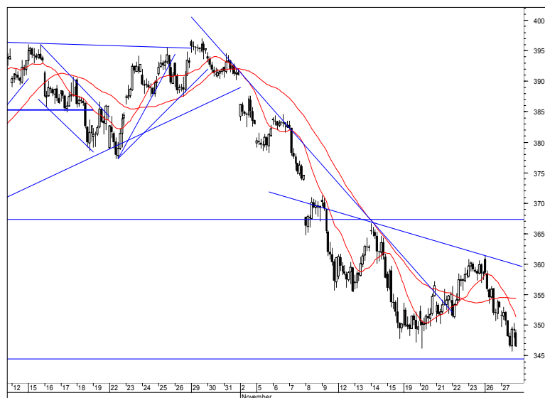
Rys. nr 2 FW20 - wykres 60 min