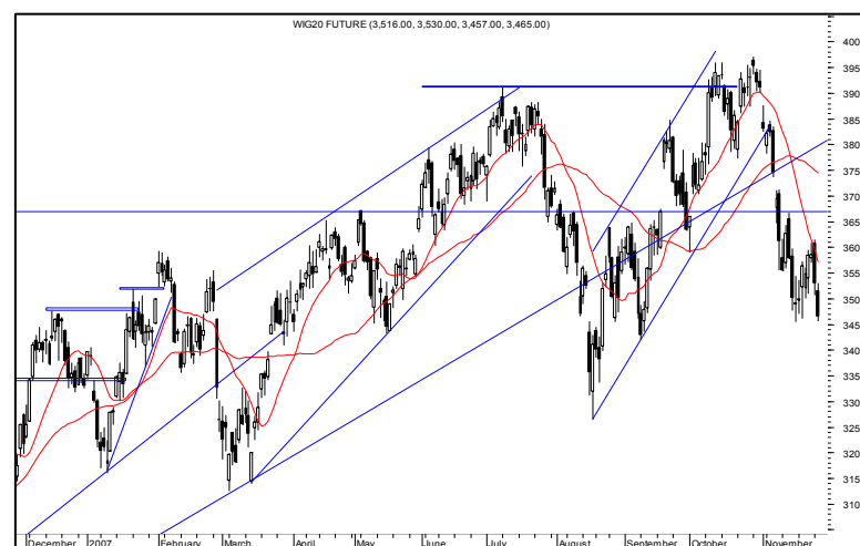
Rys. nr 3 FW20 - wykres dzienny