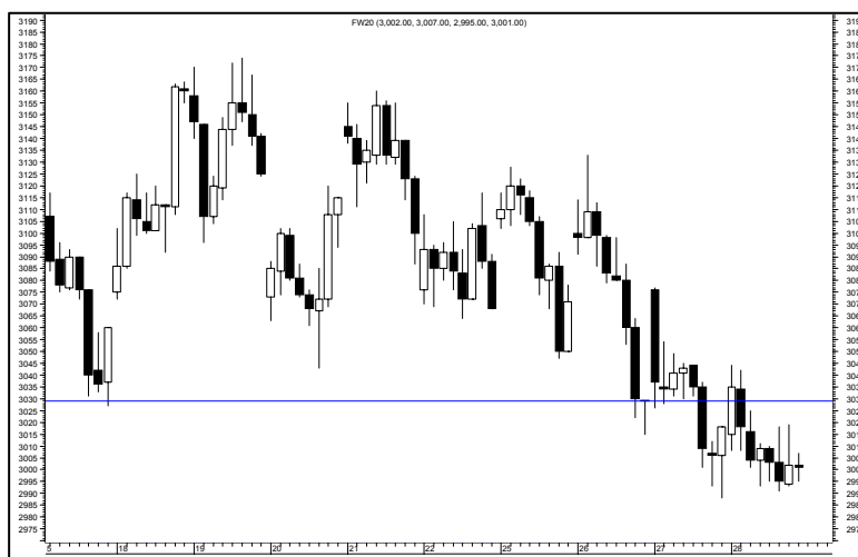
Rys. nr 2 FW20 - wykres 60 min