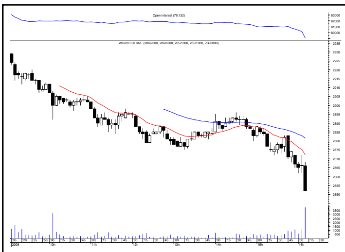
Rys. nr 2 FW20 - wykres intra 5 minutowy ostatniej sesji i liczba otwartych pozycji