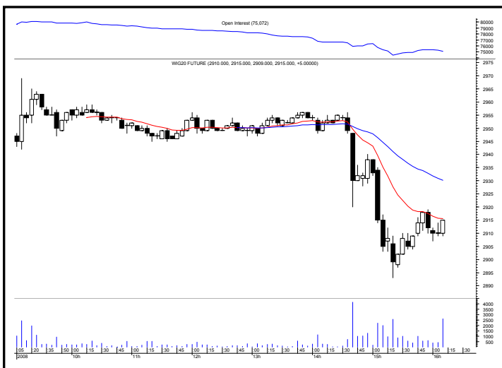
Rys. nr 2 FW20 - wykres intra 5 minutowy ostatniej sesji i liczba otwartych pozycji