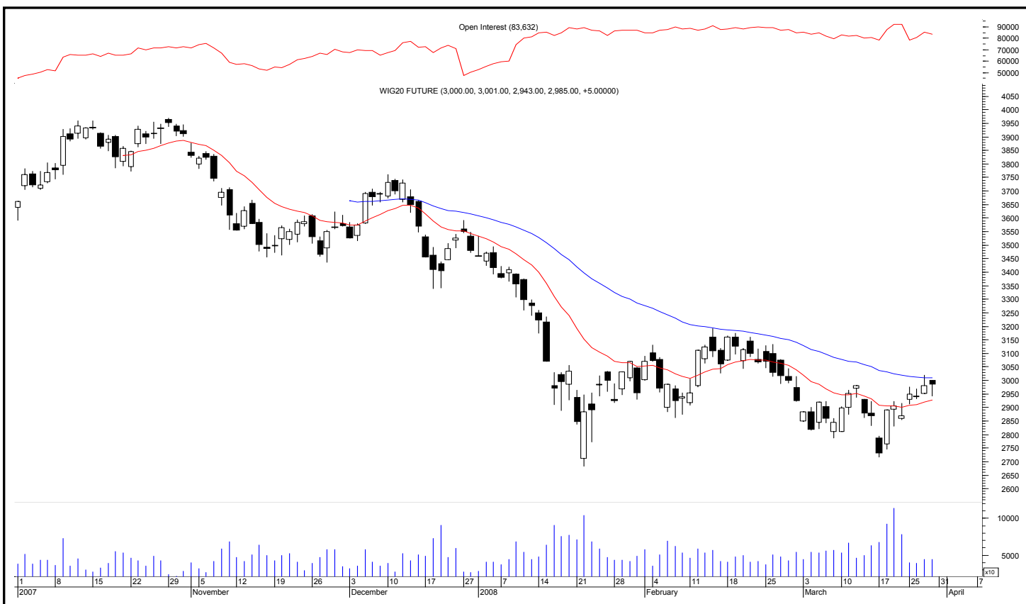
Rys. nr 1 FW20 - wykres dzienny świecowy i średnie wykładnicze 15 i 45 oraz liczba otwartych pozycji

Kontrakty terminowe na WIG 20 - komentarz