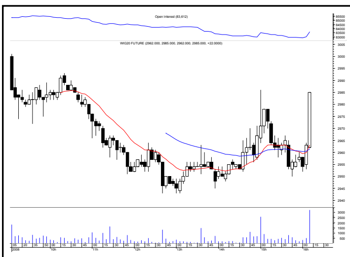
Rys. nr 2 FW20 - wykres intra 5 minutowy ostatniej sesji i liczba otwartych pozycji