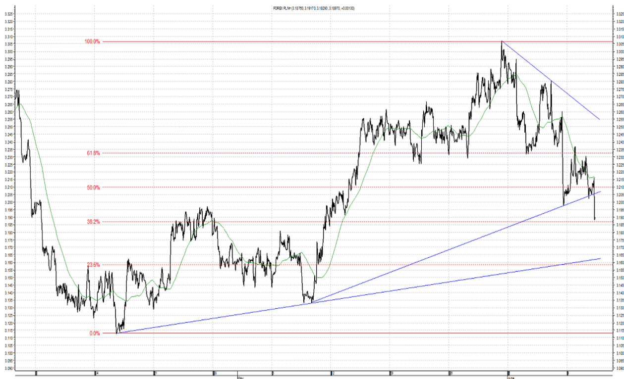
Wykres kursu średniego USD/PLN, za okres od 14.04.2013 do 12.06.2013

Kurs USD/PLN znajduje się w trendzie spadkowym. Na wykresie linia kursu przebija kolejne poziomy wsparcia jakimi były 50,0% zniesienie Fibonacciego oraz linia trendu. Obecnie kurs zatrzymał się na poziomie 38,2% zniesienia Fibonacciego na poziomie 3,1870. Dalsze spadki może zatrzymać kolejna linia trendu, która obecnie znajduje się na poziomie 3,1625.