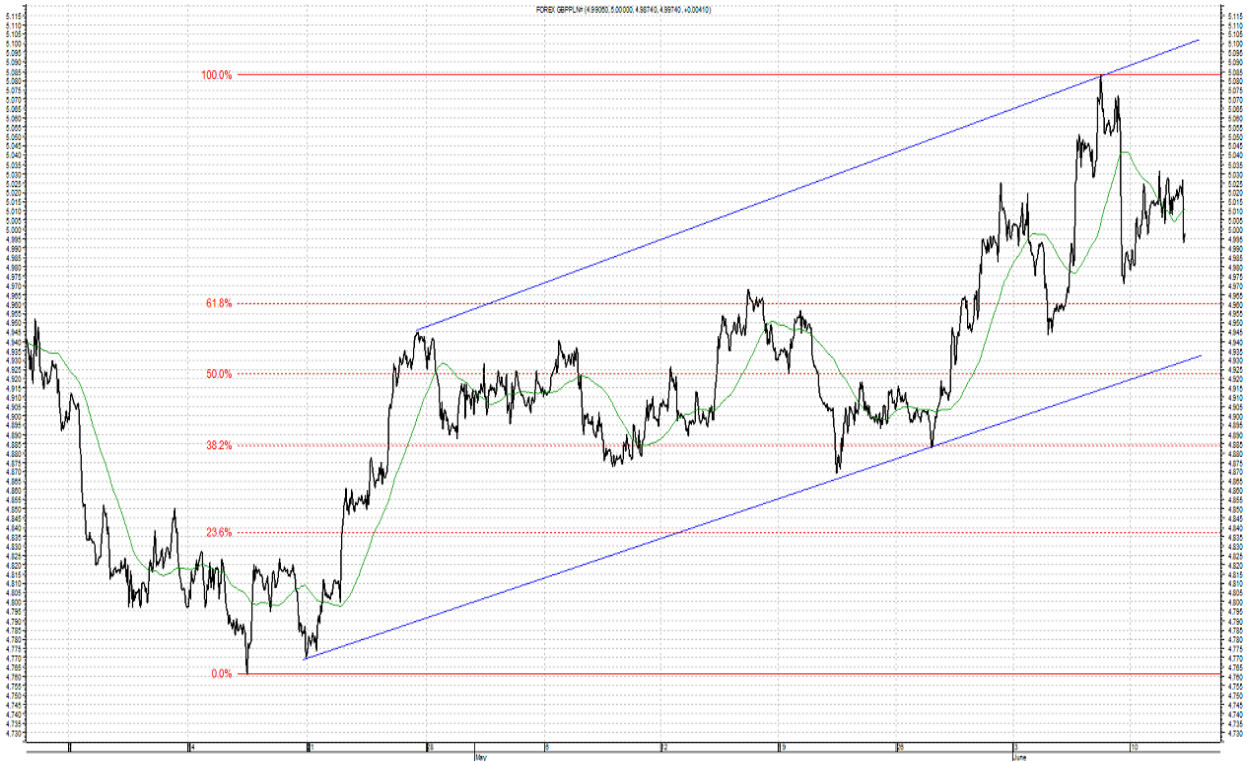
Wykres kursu średniego GBP/PLN, za okres od 14.04.2013 do 12.06.2013

Funt brytyjski po korekcie znajduje się po środku kanału wzrostowego oraz pomiędzy 100,0% i 61,8% zniesieniem Fibonacciego. Zniesienia są na poziomach odpowiednio 5,0840 i 4,9600. Jest to ogromny przedział dla zmian kursu dlatego bardzo trudno jest przewidzieć zachowania tej pary walutowej. Należy moim zdaniem się sugerować analizą pozostałych par walutowych dla funta sterlinga.