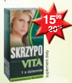
Skrzypovita tabletki poprawiające kondycję włosów, skóry i paznokci 40 szt.