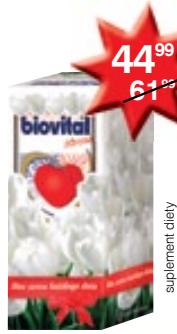
Biovital zdrowie 1000ml