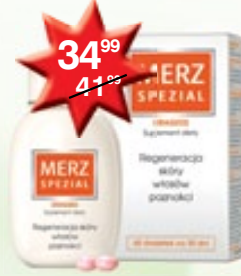
Merz Spezial Dragees drażetki poprawiające kondycję skóry i włosów 60 szt.