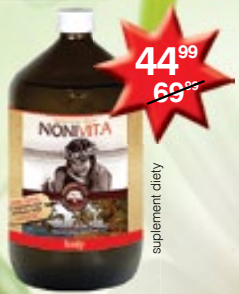
Laboratoria Natury Nonivita sok z Noni stosowany w stanach zmęczenia i stresu oraz w stanach osłabionej odporności organizmu 1000 ml