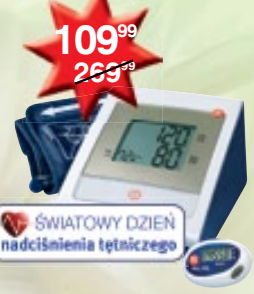
PIC Indolor Classic Check ciśnieniomierz automatyczny + krokomiernik GRATIS