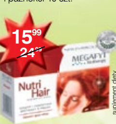
Nutri Hair kapsułki poprawiające kondycję włosów 60 szt.