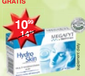
Hydro Skin kapsułki nawilżające skórę 30 szt.