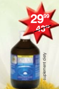
Laboratoria Natury Srebro Koloidalne płyn wspomagający funkcjonowanie układu odpornościowego 300 ml