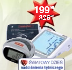
Medel Elitte ciśnieniomierz automatyczny + Medel Step krokomiernik GRATIS