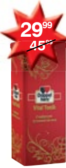
Doppelherz Vital Tonik puszka, dla mamy i taty 750 ml lub 1000 ml