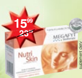
Nutri Skin kapsułki poprawiające kondycję skóry 60 szt.