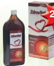
Zdrovital Tonik poprawiający kondycję organizmu 1000 ml

Substancja czynna: Preparat złozyony. Postać: Zawiesina doustna. Wskazania: osłabienie pamięci i koncentracji, stany stresowe, nadpobudliwość nerwowa, bezsenność, stany wyczerpania fizycznego i psychicznego (przepracowanie, wyczerpanie, szybkie męczenie się), pomocniczo w doległościach sercowych na tle nerwowym, objawy niedoboru witamin z grupy B, stan rekonwalescencji po przebytej chorobie, pomocniczo u osób w wieku starszym, zapobiegawczo w miażdżycy naczyń, zapobiegawczo i pomocniczo przy podwyższonym poziomie cholesterolu we krwi. Przeciwwskazania: nadwrażliwość na substancje czynne lub którąkolwiek substancję pomocniczą. Ze względu na zawartość alkoholu produktu Vita Buerlecithin płyn nie stosować u: dzieci poniżej 12 roku życia, kobiet w ciąży i karmiących piersią, osób ze schorzeniami wątroby, padaczką, chorobą alkoholową, uszkodzeniami mózgu. Ze względu na zawartość sacharyzy produktu Vita Buerlecithin płyn nie należy stosować u osób z dziedzicznymi występującymi schorzeniami takimi jak: nietolerancja fruktozy, zespół złego wchłaniania glukozy-galaktozy, niedobór sacharyzy-izomalazy Podmiot odpowiedzialny: Nycomed Pharma sp. z o. o.