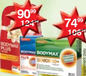
Bodymax Plus 200 szt., Bodymax Senior Plus 120 szt. tabletki zwiększające wydolność fizyczną i psychiczną organizmu, zwiększające odporność na stres