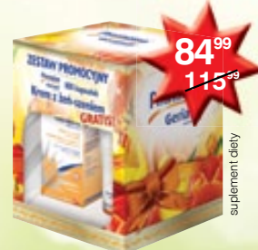
Pharmaton Geriavit kapsułki z witaminami 100 szt. + krem do rąk z żeń-szeniem GRATIS